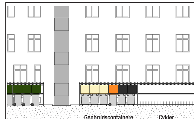
Skitse fra baggården med espalier-overdækning ved containere og cykler

Derfor har vi gennemgået DV-planen og fundet pengene dér. Bl.a. har vi sparet rigtig mange penge i forhold til budgettet, ved at renovere trappebelægningen i stedet for at udskifte linoleum. Resten af midlerne har vi fundet ved at udskyde "Maling af alle overflader på trappeopgangene" til 2016-17. Derfor kan projektet gennemføres uden huslejeforhøjelser.