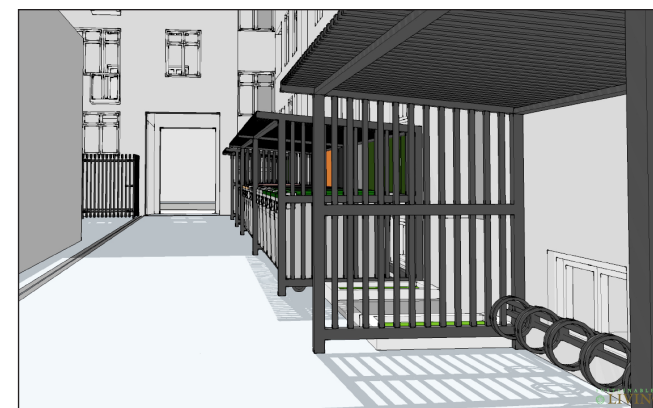
Skitse fra baggården mod Ryesgade