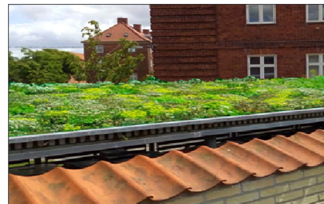
Eksempel på grønt tag